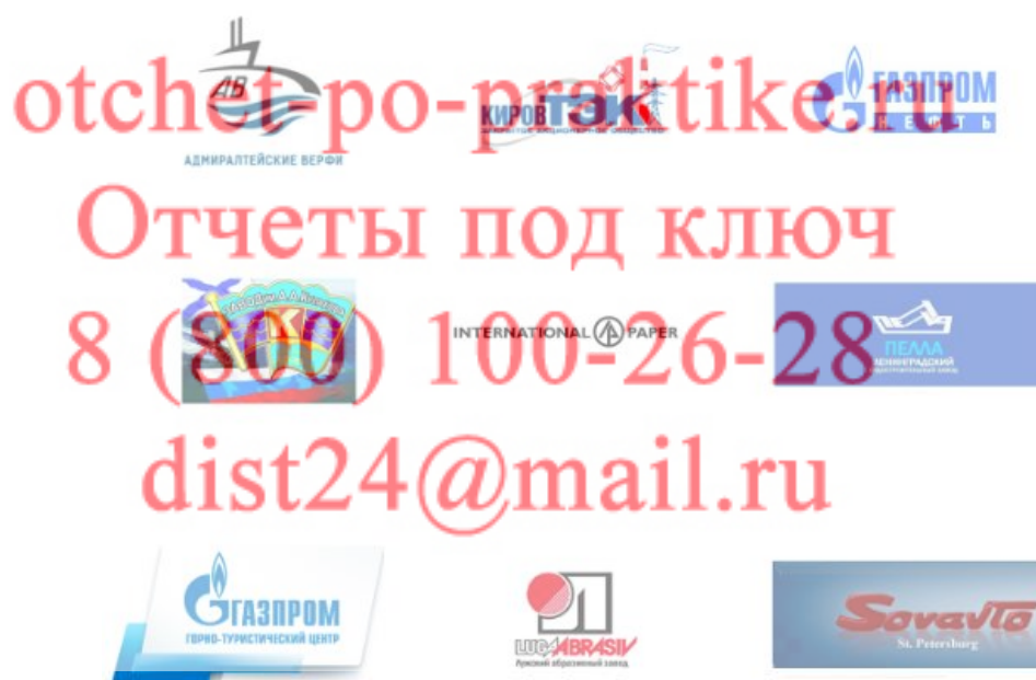
Рисунок 1 - Клиенты ООО «ВентКомплекс»

Клиенты ООО «ВентКомплекс» приведены на рисунке 1.